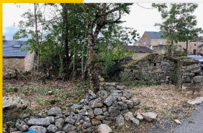
Nettoyage, abattage des arbres place du Couderc en vue de la création d'un parking

L'appréhension de biens vacants a permis la démolition de deux ruines situées à proximité de la ferme de messieurs Peyre, participant ainsi à améliorer l'aspect visuel de ce quartier.